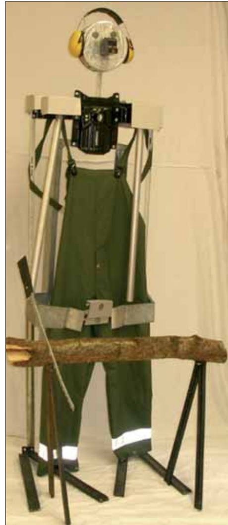
Skulptur aus Metall-/Computer-schrott mit Holzstamm und Regenanzug – ohne Titel –

Das Risiko, durch die Erkrankung auch die materiellen Existenzgrundlagen zu verlieren, erhöht sich insbesondere für verheiratete Betroffene mit Kindern. Bei Menschen mit erworbener Hirnschädigung, die auf eine langfristige Rehabilitation oder gar dauerhafte Betreuung und Pflege angewiesen sind, erhöht sich