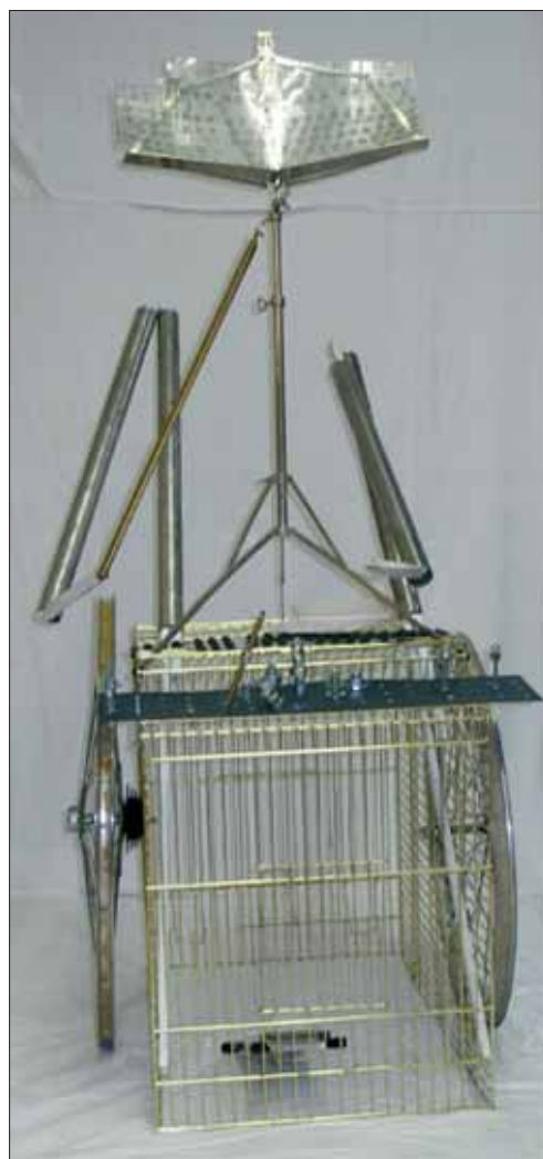
Skulptur aus Metall-/ Computerschrott – ohne Titel –

Wir unterstützen Menschen mit erworbenen Hirnschädigungen dabei, angemessene Perspektiven für Arbeit und Beschäftigung zu realisieren, und knüpfen dabei, wenn möglich, an die frühere Berufsbiografie und daraus resultierende Kompetenzen und Fähigkeiten an. Unsere Angebote reichen dabei von Integrationshilfen am früheren Arbeitsplatz bis zu Tätigkeiten in speziellen Werkstätten für behinderte Menschen. Wir setzen uns dafür ein, individuelle (Arbeits-)Angebote auch für Menschen mit einem hohen Unterstützungsbedarf zu schaffen und entsprechende Unterstützungs- und Arbeitsmöglichkeiten zu entwickeln.